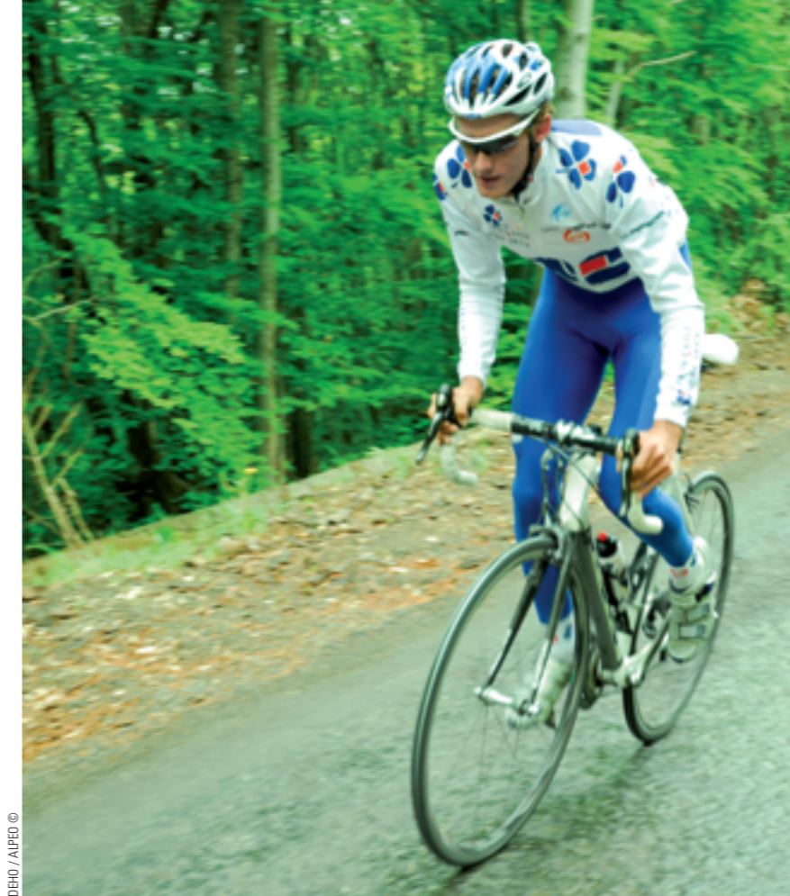
IDEHO / ALPEO ©

“ Je rêvais de suivre les traces de Jean-Marc Gaillard ”